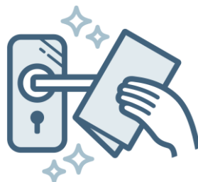
定期的な 共有部の消毒※